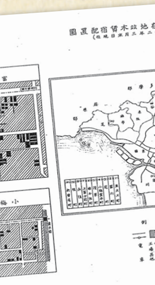
「行旅病人及行旅死亡人取扱法ニ関スル事項」(1934年、『第六十五回帝国議会社会局関係参考資料』)【第3巻】