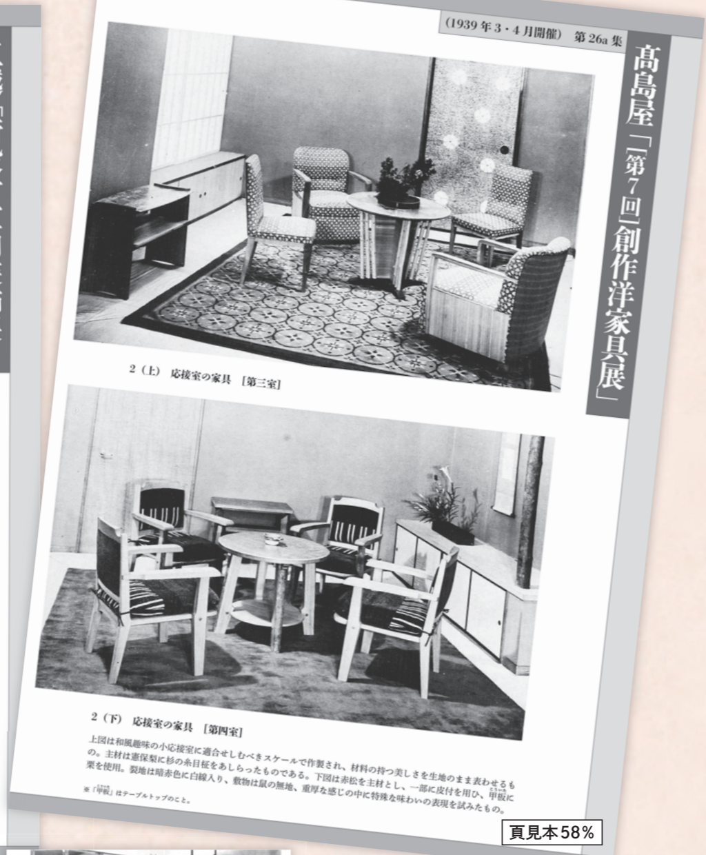
2 (上) 応接室の家具【第三室】