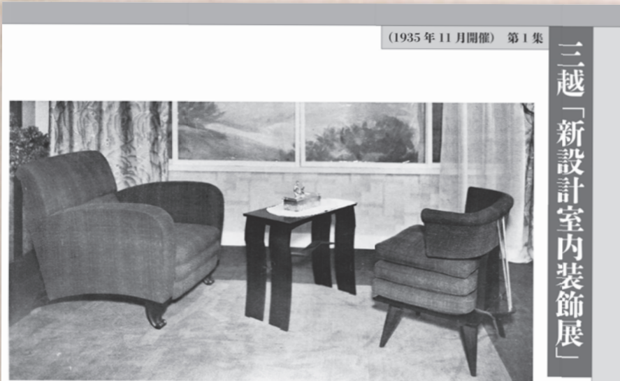
2 題「新設」 客間・B