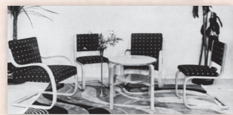
バンブーチェア（高島屋「[第7回]創作洋家具展」1939年3・4月開催、第26集）