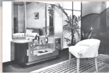
寝室の家具（三越「新設計室内装飾展」1935年11月、第1集）