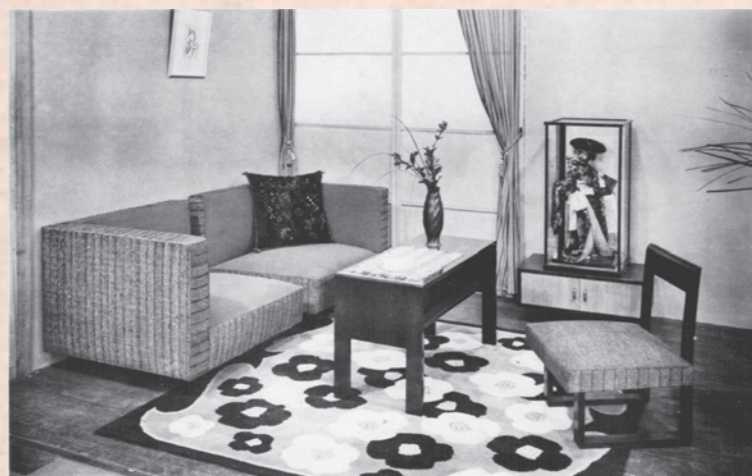
居間の家具（白木屋「洋家具逸品会」1939年10月、第34集）