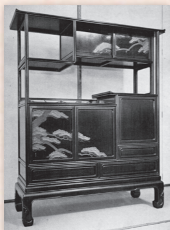
飾棚（松坂屋「紫江会指物展」1937年11月、第15集）