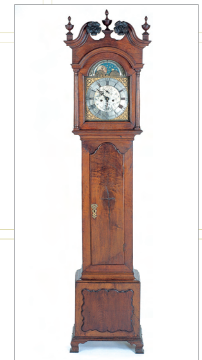
ジョージ・ミラーによる箱型振り子時計の仕掛け時計、アメリカ、1796年