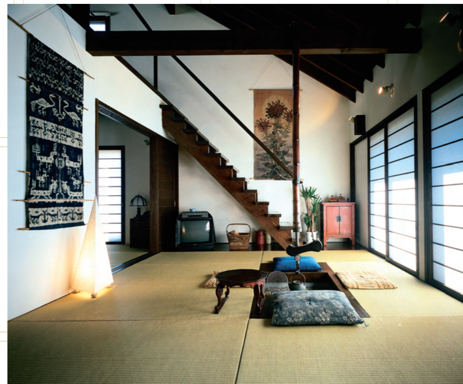
彦根アンドレア設計のカーサ・木村の居間、東京、1995年頃