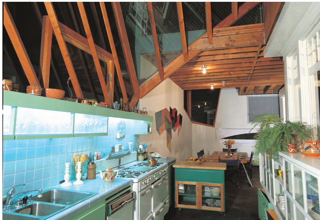
フランク・ゲーリー、ゲーリー自邸、ロサンゼルス、1978-88年

居住の歴史が始まった約6000年前に遡り、各時代を追って、宗教建築から現代の個人住居まで、それぞれに活かされたインテリアデザインを代表的作品事例と共に紹介する。ヨーロッパ、アメリカからアジア、イスラム圏までをも網羅した迫力の一冊！