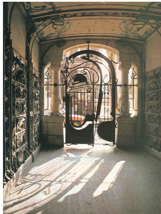
エクトール・ギマル、カステル・ペランジェ、パリ、1894-99年