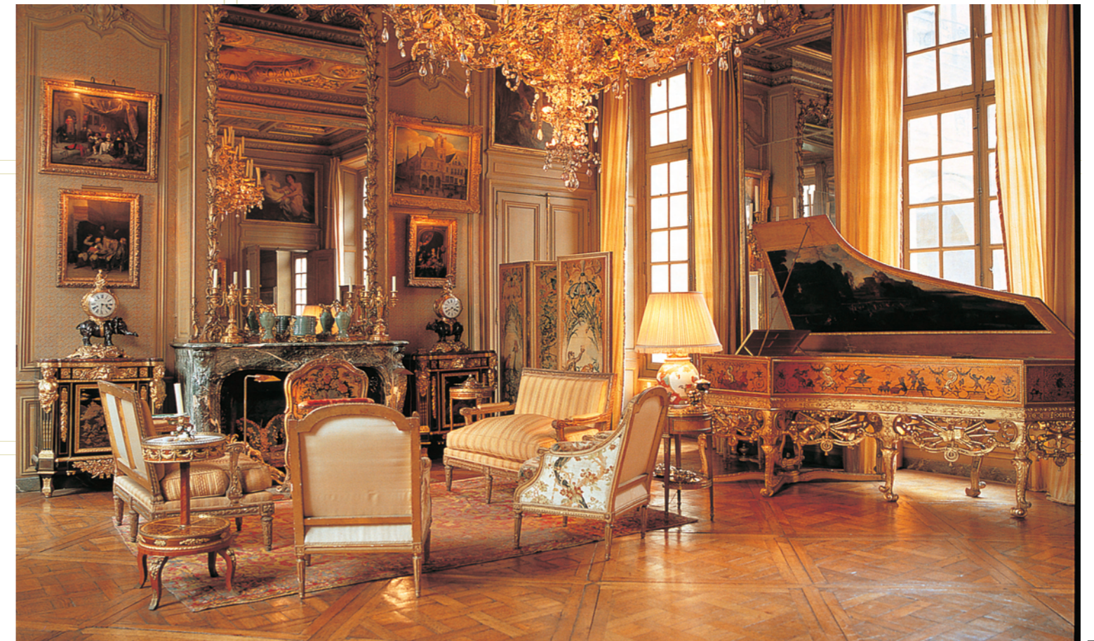
サロン、パリの邸館、サン・ルイ島、パリ、18世紀